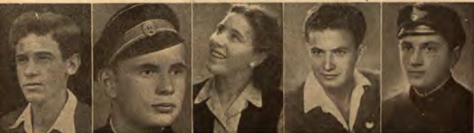
Георги Русев Ямбол

Районът украсен с много знамена, на платца издигната трибуна, а всичко наоколо изпълнено с младежи, които щом забелязаха влака с радостни викове се спуснаха към мястото, където щеше да спре. Издигаха лозунги, много от тях на непознати езици, в които името на Георги Димитров беше единственото нещо, което разбиряхме. Гръмна и нашето непрекъснато и мощно ура. После, преди още да слезем от вагоните, ни грабнаха на ръце и отнесоха до мястото, където до късно ве-