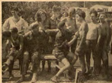
Сдигнен общ медицински преглед, извършен от червенкръстите при Бълг. амбулатория „Д-р Рачо Ангелов“

На кухнята стените варосани и украсени с рисунки, а всички съдове така излъквани и подредени, че нъчно можеше да се