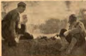
Шведски младежки-червенкръстски край лагерния огън

експреса за Стокхолм. Това беше едно дълго пътешествие и ние трябваше да се прехвърляме на три пъти докато достигнем в 5 часа вечерта. На гарата ни очакваха автомобили, за да ни закарат в лагера отстоящ на 10 мили от гарата.