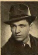
Георги Иконова Юстиндия