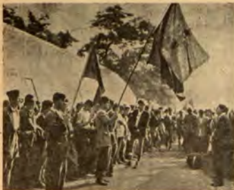
Албанска младежка бригада