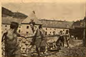
На обекта кипи съревнование