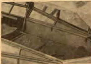
Вътрешност на самолета

В последните години, в страните със силно развита самолетна индустрия, започнали да правят опити, които се показали напълно успешни за използване като санитарен новия тип самолет — така наречения хеликоптер, който позволява освен познатите нам постановелни движения по посока на дъж на самолета, но също така и движения в посока на вертикална му ос или застояване във въздуха на желана височина. Това ценно качество позволява, при даване на бърза медицинска помощ, самолета да каца на съвършено малка пло-