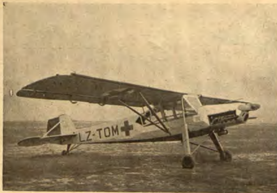
Санитарният самолет е готов за излитане

през 1934 година, на които конгреси са били разглеждани въпросите свързани със санитарното въздухоплаване: пропагандирането му, приложението му и международното сътрудничество между отделните национални организации, интересът към санитарното въздухоплаване е бил засилен още повече. Понастоящем значението на въздушното санитарно дело в много страни е правилно оценено и на въздушно санитарните организации е отдадено заслужено внимание.